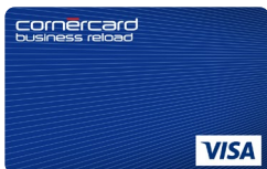
Cornercard Business Prepaid