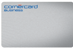
Cornercard Business Classic