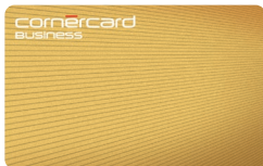
Cornercard Business Gold